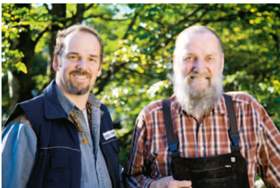
Vater und Sohn arbeiteten über 30 Jahre zusammen.